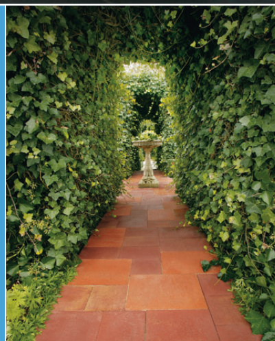
Koppelstones in een mix van formaten, gelegd in wildverband. De bijzondere kleur Avondzon geeft de steen een diepe gloed.

In de gemiddelde achtertuin ligt de verhouding bestrating en beplanting fifty-fifty. Belangrijk is om deze twee items goed op elkaar af te stemmen. Een kleinere tuin vraagt andere aandacht dan een grote tuin. Zo kan een opvallende steen in een kleine tuin heel goed tot zijn recht komen, waar dezelfde steen bij een grote tuin veel te overweldigend kan zijn. Hoe dan ook, uitgangspunt is uw persoonlijke smaak, waarbij wij aanraden om het totaalplaatje van de tuin en de aansluiting op uw woning goed in de gaten te houden. ►►