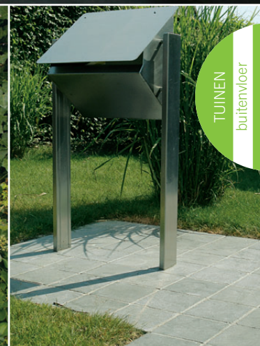
Blauw-grijs Kalksteen uit de collectie Jinin Stone, oude kasseidallen.